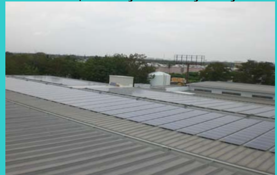
Paneles solares sobre techo de Mini Warehouse de Carolina